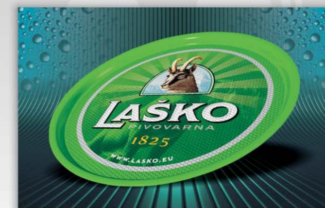
TACE OKRĄGŁE PŁASKIE