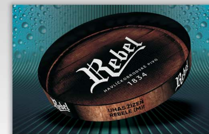
TACE OKRĄGŁE Z RANTEM